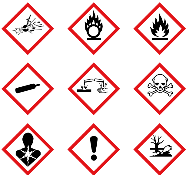
De nio symbolerna (faro-piktogram) som används i märkningen för olika typer av faror.

Kemikalieinspektionen har en plansch som ger en bra översikt över CLP-förordningens alla faroklasser och farokategorier och vilken märkning i form av faroangivelser, piktogram och signalord som följer av respektive klassificering. Planschen ger också en förklaring till vad de olika koderna i klassificerings- och märknings-systemet i CLP står för.