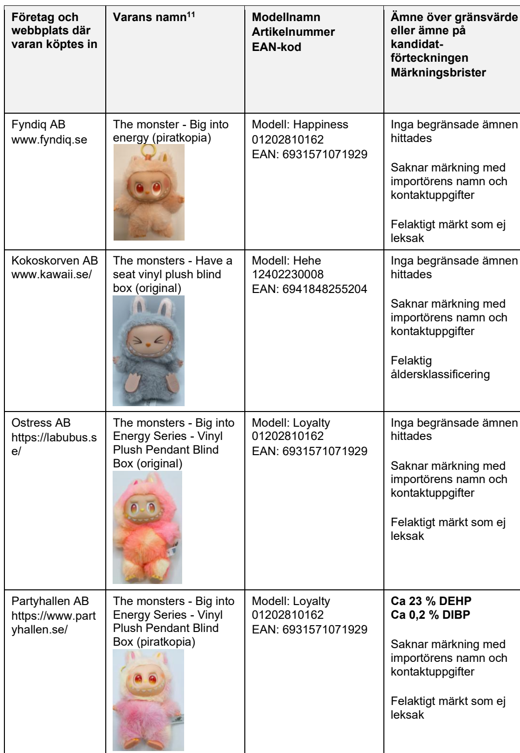
Tabell 1. Varor som Kemikalieinspektionen köpt in från återförsäljare och kontrollerat med avseende på begränsade ämnen och märkning.